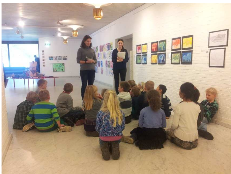
2 klasse på Kunsten